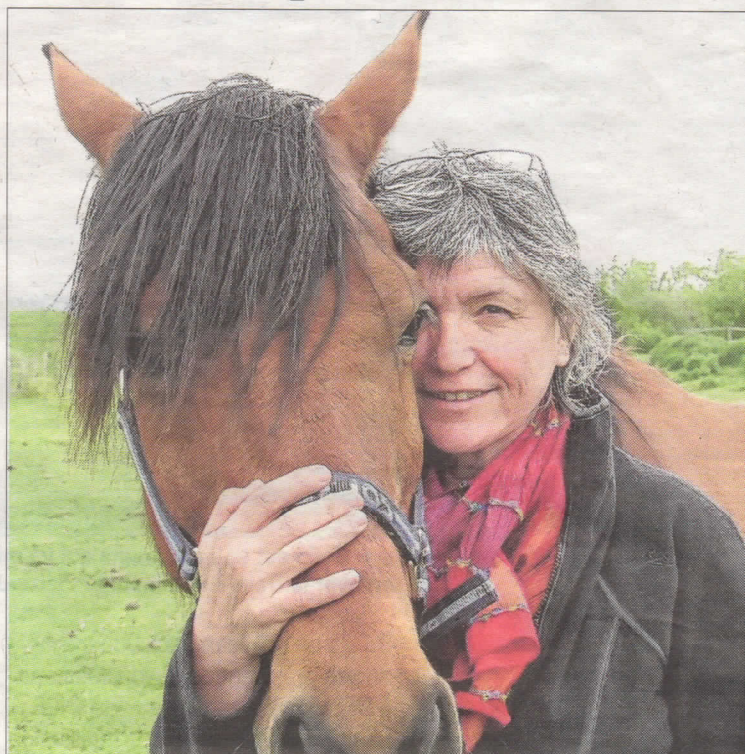
■ Le cheval Hélios est très réceptif à la pratique de l'équithérapie.

« Je vais animer des ateliers, à Devecey, lors des rencontres biodynamique. Je me déplace avec six chevaux. Le congrès international d'équithérapie psychocorporelle se déroule en Grèce. J'y présenterai l'évolution de mon travail.